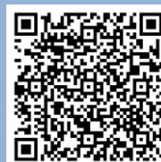
应用学位课程 的指引