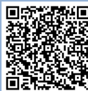
應用學位課程 的指引